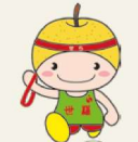
世羅町イメージキャラクター せら坊