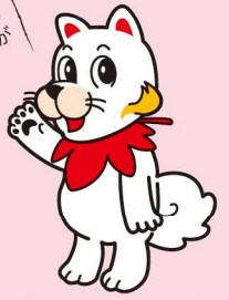
広島広域都市圏 マスコットキャラクター ひろしま都市犬はっしー